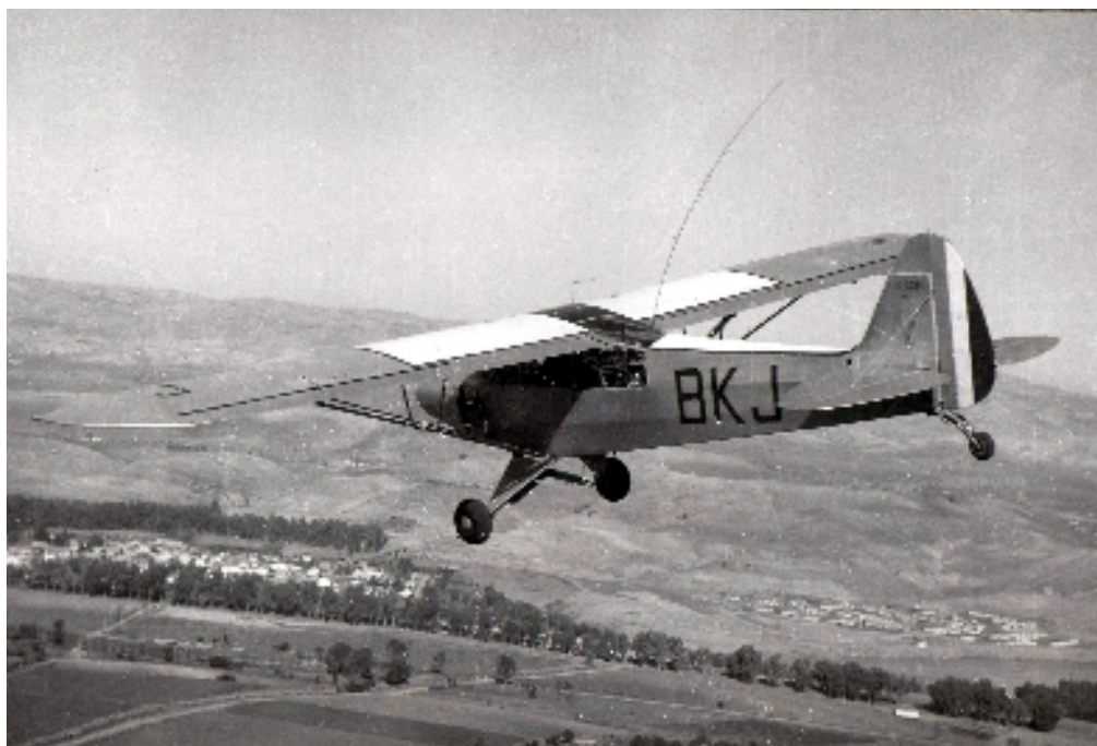
Un Piper L-21 du peloton d'Orléansville.

— Alors il n'y a qu'une seule solution, c'est que vous le preniez sur vos genoux.