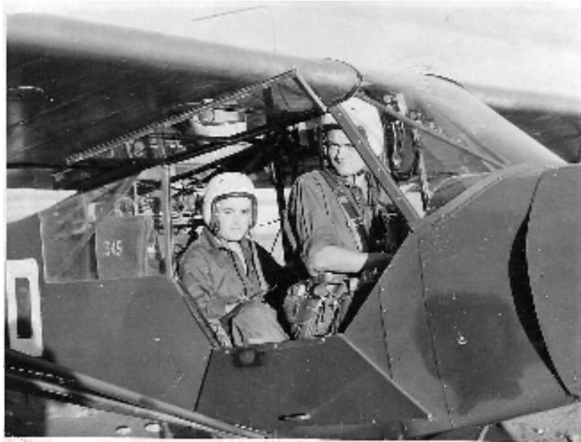
L'auteur aux commandes d'un Piper en août 1958.