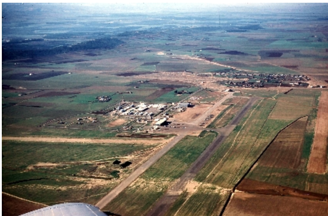
La base d'Orléansville.

Mais cela fait déjà plus de trois heures que nous sommes en l'air et c'est maintenant à notre tour de devenir les guides de notre relève en les invitant à faire le tour du propriétaire, avant de mettre le cap sur la base.