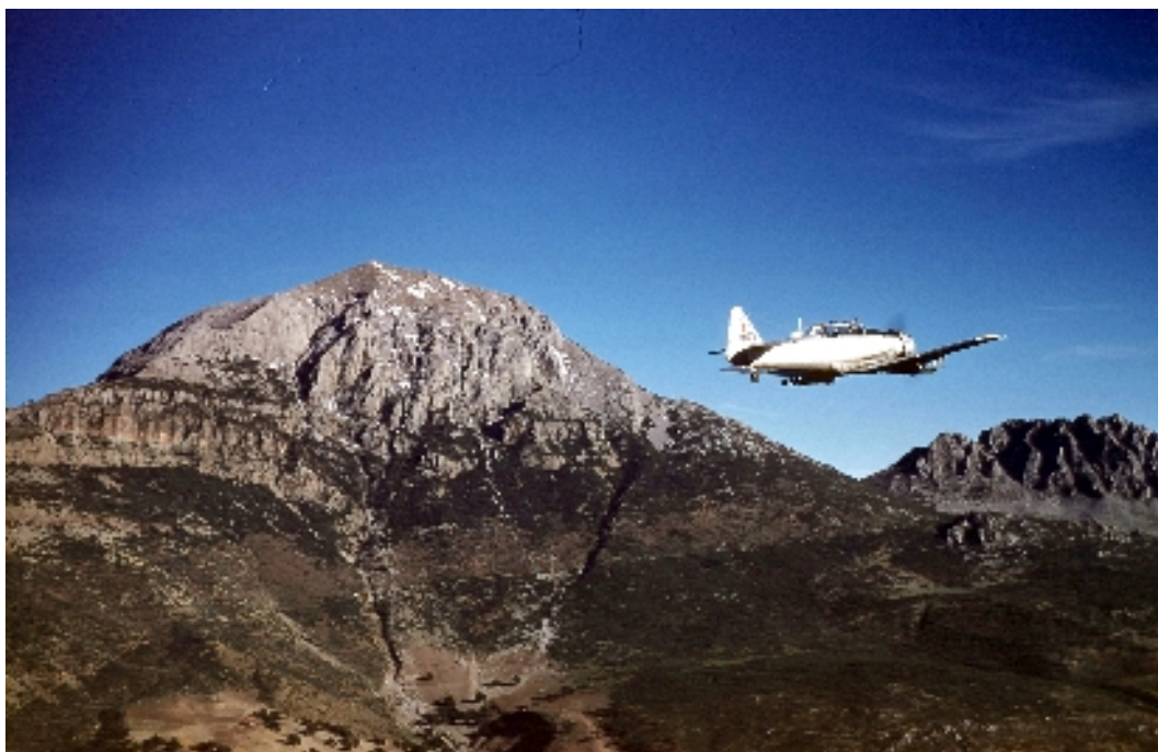
Un T-6 en mission d'appui dans l'Ouarsenis.

Bref, Bébé Rose prend contact avec les différents acteurs avant que débute notre quête. Je me méfie de la zone où j'ai suivi Nounours et je la survole sans trop m'y attarder. Je commence à présent à voler tout autour d'une façon concentrique. Bébé Rose observe principalement vers l'arrière de l'avion pour voir s'il n'y a pas de mouvement au sol après notre passage. Pour ma part je scrute bien devant moi, je suis très tendu et prêt à dégager immédiatement en cas de besoin. Par moments, mon équipier pose la main sur mon épaule du côté où il lui semble avoir vu quelque chose bouger. A l'instant même je vire de bord pour repasser au-dessus du point suspecté. Ces contacts font partie d'un code et c'est selon la pression exercée par la main que l'observateur traduit l'urgence du changement de cap souhaité. Souvent, tout excité d'avoir trouvé quelque chose, certains observateurs vont jusqu'à tirer très fort sur l'épaule du pilote. Ce geste implique déjà à l'avion l'amorce d'un virage sur l'aile du côté désiré et cela se traduit souvent par une sorte de renversement. Ce genre de manoeuvre a toutefois pour avantage de repositionner presque immédiatement l'avion au-dessus du point à observer et il n'y a donc pas de perte de temps en longs bavardages explicatifs.