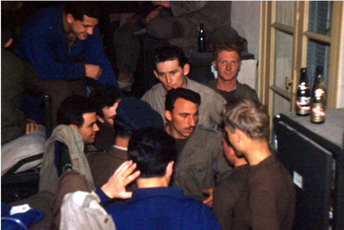
Avril 1960. Enfin la quille !