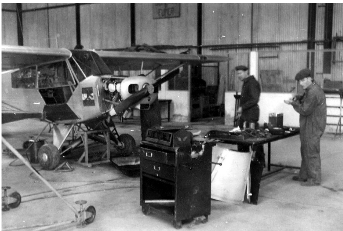
Les mécanos avions préparant un Piper.

A mon retour j'ai intégré la salle d'opération, travail qui consistait à recevoir les ordres relatifs aux opérations de vols d'avion ou d'hélicoptère que le QG de la 13 e DI. adressait aux officiers et sous-officiers chargés de coordonner les troupes au sol. Il fallait faire parvenir le courrier à des petites unités isolées et je devais vérifier qu'il n'y avait rien dedans qui puisse se casser car certains secteurs n'avaient pas de piste d'atterrissage : tout était envoyé par largage, y compris les distributions de tracts de propagande.