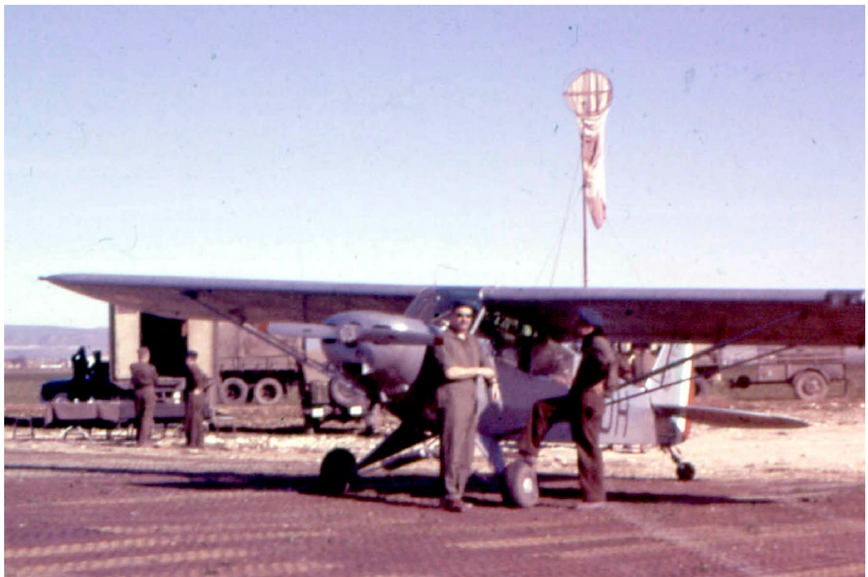
L'équipage d'un Piper s'apprête à partir en mission.