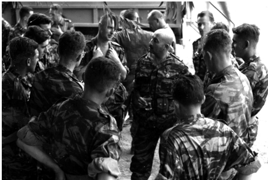
Août 1959, opération "Jumelles". Prise d'armes sur le terrain d'Akbou et pot de l'amitié.

Texte mis en forme par Christian Malcros pour le site www.alat.fr