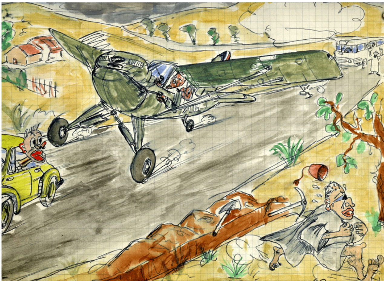
Poser d'un Piper sur une route (dessin X, via Claude Mourlanne).

opérationnel qui sommeillait en moi se réveille. Malgré ma faiblesse, je me lève. Les jambes sont chancelantes mais le mental est là. Je suis parvenu à tenir sur un vol de trois heures trente. Dire que ces heures furent agréables, non ! Par contre, elles furent utiles.