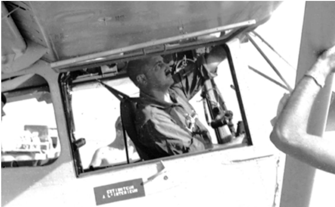
L'auteur aux commandes d'un Cessna L-19E en 1959.