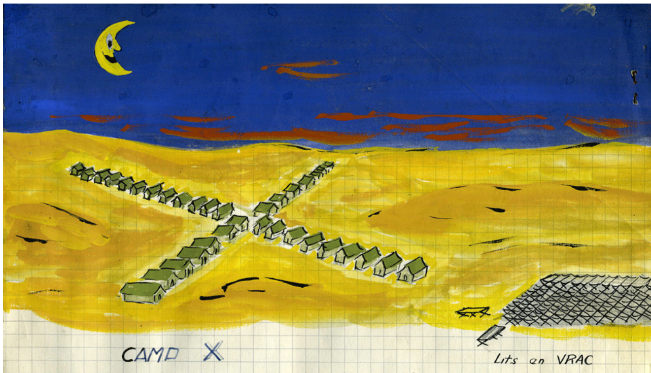
Le camp X à Chypre, en novembre 1956 (dessin X, via Claude Mourlanne).

mes besoins immédiats. L'opération terminée, je rejoins notre appareil en sifflant. Voilà comment un Français assis brièvement sur le trône (britannique en l'occurrence) a eu raison de l'entente cordiale et du rapprochement entre les deux ALAT.